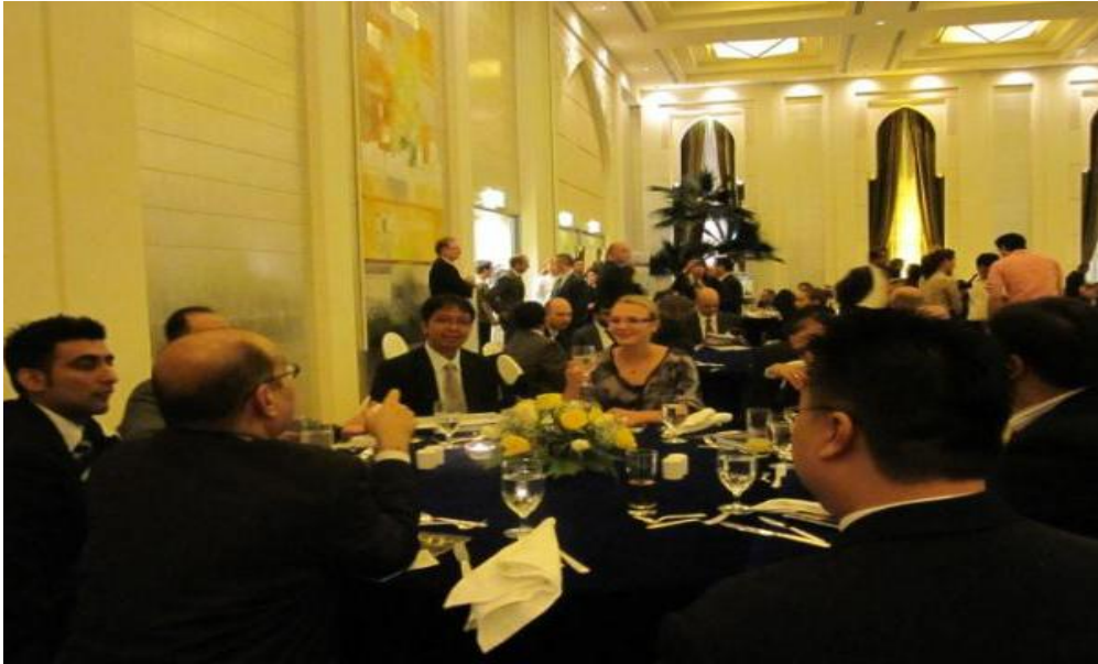
Acara Business Meeting Lepmida dengan Pemda di Abu Dhabi